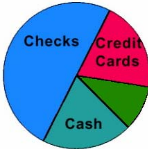
■ Cash ■ Checks ■ Credit Card ■ Other